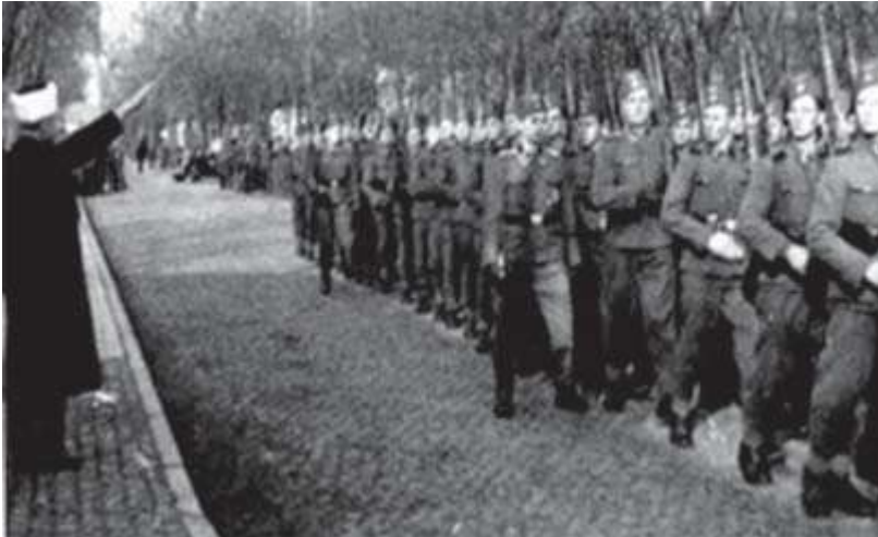
Hüseyini, Alman saflarında çarpışmak üzere cepheye giden Müslüman askerleri "Heil Hitler" diye uğurluyor.