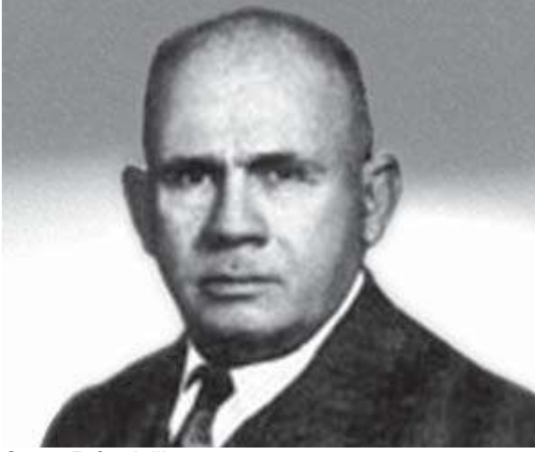
Cevat Rifat Atilhan

Avukatının açıkladığı üzere, Siyonizm'e karşı olduğu için Hitlerin yanında yer alan Atilhan: "Almanya'ya davet edilmiş, büyük bir itibar gösterilmiş, Hitler ile tanıştırılmış ve emrine açık ve istediği kadar para çekebileceği çek verildiği halde bunların hiç birisini kabul etmemişti."