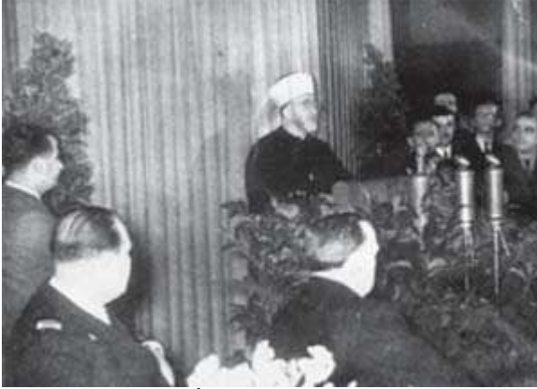
Hüseyini Berlin’de İslam Merkez Enstitüsü’nün açılış konuşmasını yapıyor. 18 Aralık 1942

Hüseyini, öyle ya da böyle, tıpkı Enver Paşa gibi Almanya’nın başarısına bel bağlamış ve yine tıpkı Enver Paşa gibi Almanya’nın güdümünde “Cihad” ilan ederek Müslümanları Almanya’nın safında savaşa çağırmıştı. II. Wilhelm’in gözünde Enver Paşa neyse, Hitler’in gözünde Kudüs Müftüsü Hacı Emin el-Hüseyini oydu. Almanlar Müslümanları kendi ordularına asker yazmak için Hüseyini’ye büyük değer verdiklerini duvarlara büyük yaftalar basıp çoğaltarak gösteriyorlardı.