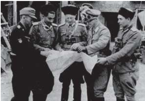
Nazi ordusunda Kafkas Türkleri

Sovyetler’de yaşayan Müslüman Türkler, bu çalışmalar sonucu Hitler’i ve Almanya’yı tıpkı Birinci Dünya Savaşı yıllarında Wilhelm Almanyası’nı olduğu gibi İslam’ın dünya üzerindeki biricik koruyucusu olarak görmüş ve Alman ordusundaki özel Müslüman birliklerinde yüzbin üzerinde Müslüman Türk de yer almıştı.