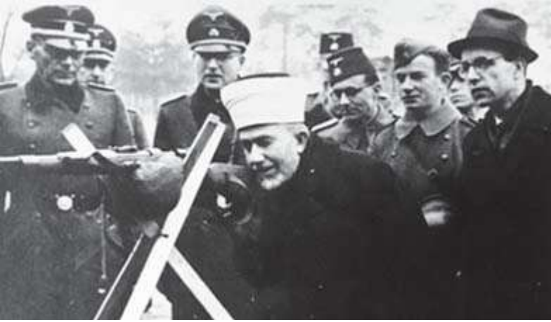
Nazi Müftüsü Hüseyini, Almanların verdiği silahları deniyor.

Bosna'ya da giden Hüseyini, oradaki Müslüman Nazi (Hancar-Waffen) birliklerini yerinde denetlemiş ve Hitler'in ordusunda savaşmanın bir Müslüman için "Mukaddes Cihad" olduğunu söylevlerle beyinlerine kazımıştı.