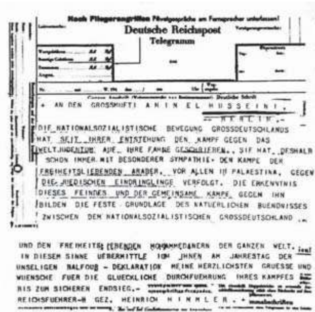
Himmler'in Hüseyini'ye telgraf. 2-11-1943

Himmler'in Hüseyini'ye Arap bağımsızlığı konusunda verdiği yanıt 2 Kasım 1943'te gelecek ve Himmler Pan-Arabizm'i değil fakat Arapların Filistin'de Yahudilere karşı verdikleri mücadeleyi desteklediklerini bildirecekti Hüseyini'ye.