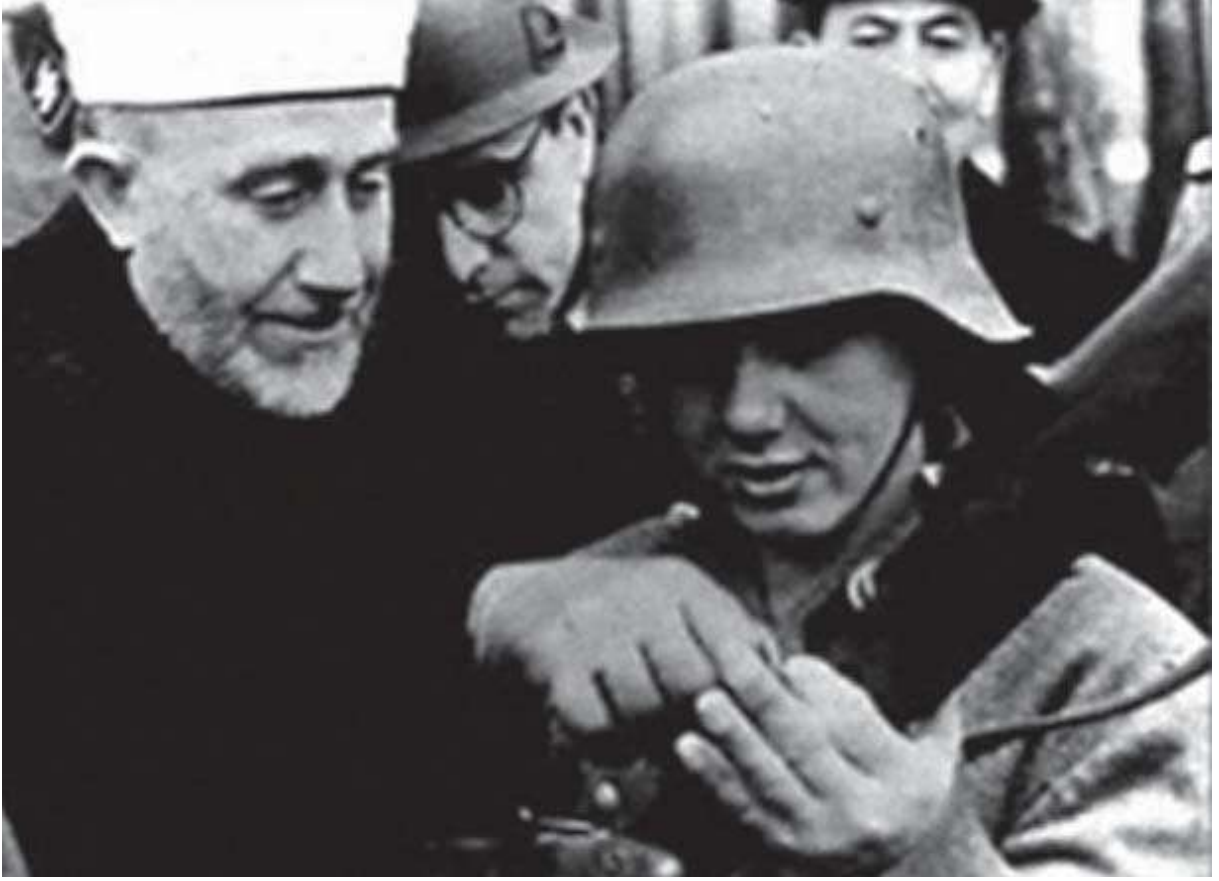
Hitlerci Müftü Hitler ordusuna aldığı müslüman gençlere silah kullanmayı öğretiyor.

Hitler, kendisini kışkırtıp para ve teknoloji sağlayarak Rusya'ya saldırtan Amerika tarafından ortadan kaldırılacak; Almanya, savaş sonunda bir Amerikan yarı-sömürgesi olacak; İngiltere ve Fransa, Almanya'ya kaptırmaktan korktukları sömürgelerini, kurtarıcı olarak gördükleri Amerika'ya kaptıracaklardı.