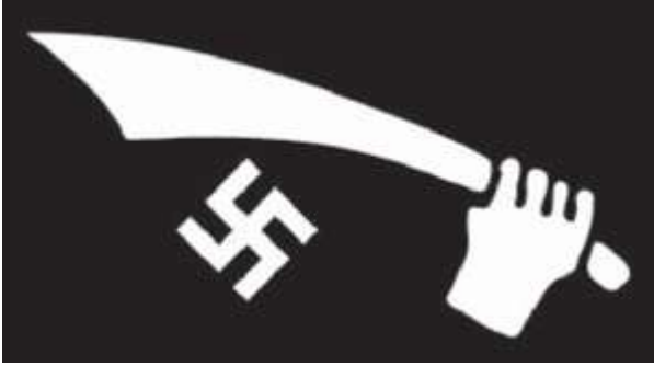
Hançerli gamalı haçlı Müslüman Hitlercilerin bayrağı

Hitler ordusunda "Hancar" (Hançer) adıyla anılan Bosnalı Müslüman askerlerden oluşan birliklerin Hüseyni tarafından çizilen bir de bayrağı vardı. Bu bayrakta bir Gamalı Haç ve kılıç sallayan bir el yer alıyordu.