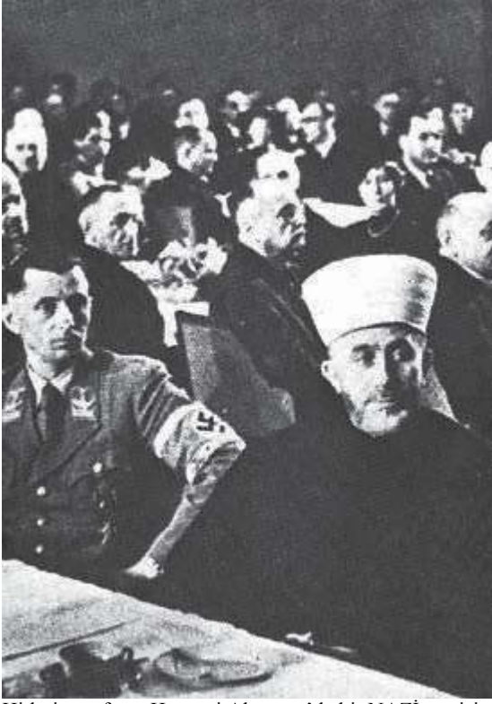
Hitlerin müftüsü Hüseyini Almanya'da bir NAZİ partisi toplantısında.