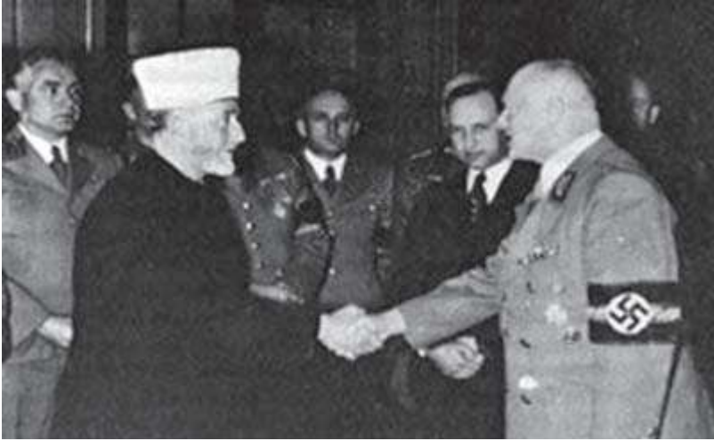
Hacı Emin El-Hüseyini, yüzbinlerce Müslüman'ı Alman ordusu saflarına katma başarısı nedeniyle Nazi subayları tarafından kutlanıyor.

Tıpkı I. Dünya Savaşı'nda Almanya ile işbirliği yapan Osmanlı, Alman İmparatoru II. Wilhelm'i müslüman dünyaya "Gizli Müslüman Hacı Wilhelm" diye tanıttığı gibi; II. Dünya Savaşı'nda bu kez de Hitler'in gizli Müslüman olduğu yayılmaya başlamıştı İslam dünyasında. Nasıl 1920'lerde hatasını anlayan Mehmet Akif 1910'lu yıllarda dünya Müslümanlarını Alman İmparatoru'nun buyruğuna sokmak için çabalamışsa, 1930'lu, 1940'lı yıllarda da Kudüs Müftüsü Hacı Emin El Hüseyini de Hitler başarılı olursa Filistin'de Yahudi sorunu kalmaz düşüncesiyle Hitler'le buluşmuş, görüşmüş, düşünce birliğine varmış, desteklemiş; Nazi propaganda takımına katılmış, Alman radyolarından Müslümanlara seslenerek tüm Arap dünyasına Hitler'in komutasında savaşa katılmaları çağırısında bulunmuştu.