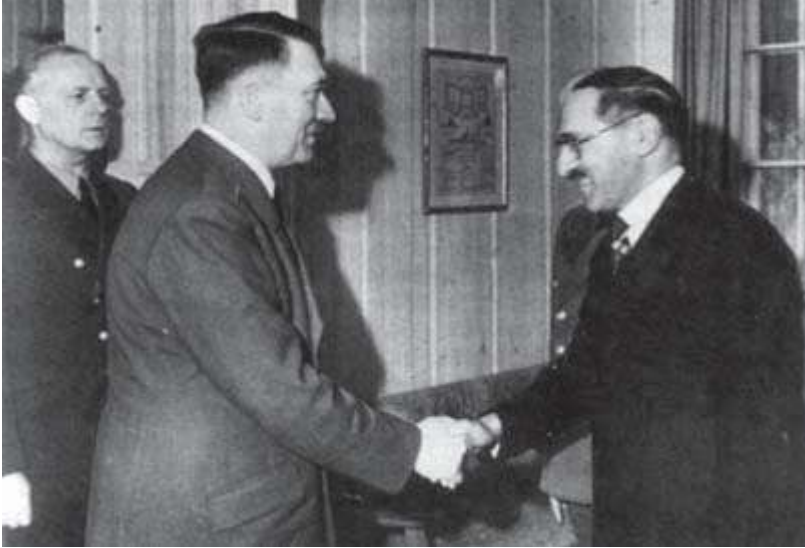
Seyid Raşid El-Geylani Hitler ve Ribbentrop'la Berlin Karargahında (Aralık 1941)

1933-1941 arası üç kez Irak Başbakanlığı koltuğuna oturmuş olan Seyyid Raşid el-Geylani; Hüseyini'nin 1930'ların sonunda Irak'ta kurduğu İngiliz karşıtı darbeci gizli örgütün üyelerindendi. Hüseyini Mayıs 1941'de Irak'ta İngilizler'e karşı cihad ilan ettikten sonra İngilizler Irak'ı işgal etmiş, önce Hüseyini ve ardından iki hafta sonra da Seyyid Raşid el-Geylani Berlin'e gelmişti. Hitler ve Ribbentrop Geylani'yi Almanya'da iyi karşılamış, iyi ağırlamış; o da tıpkı Hüseyini gibi Arap Müslümanları Hitler ordusunda savaşa çağırma göreviyle radyo yayınları yapmaya koyulmuştu.