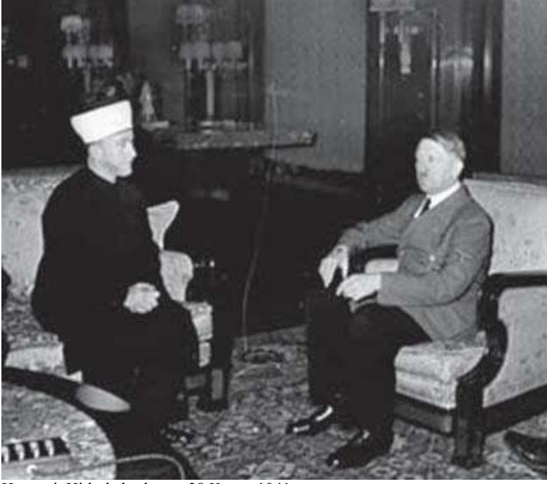
Hüseyini, Hitlerle başbaşa - 28 Kasım 1941

Bu görüşmede Hitler, Hüseyini'yi "Araplarla ilgili konularda karar verecek kişi ve Arapların önderi" olarak tanıdığını bildirmiş, gelgelelim Arap devletlerinin bağımsızlığı için kendisine herhangi bir söz vermemiş; "Alman ordusu güney Kafkasya'ya (yani Bakü petrollerine) ulaşana dek, Arapların bağımsızlığı sözünü açıkça söyleyemeyiz" demişti. Bunun anlamı açıktı: Hitler'in Rusya'ya karşı açtığı savaş, kendi topraklarında hiç petrol bulunmayan Almanya'nın Kafkas / Hazar petrollerine ulaşmasını amaçlıyordu. En az Hitler ölçüsünde Rusya'nın yıkılmasını isteyen İngiltere, Fransa ve Amerika da "Ortadoğu petrollerine el uzatmaması ve Ortadoğu'yu işgale yeltenmemesi koşuluyla" Almanya'yı gizli diplomasiyle Rusya'ya saldırmaya kışkırtıp onu gizlice destekliyordı.