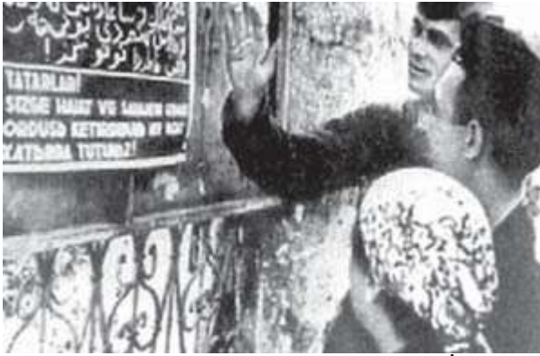
Kafkaslardaki Türk Müslümanlara yönelik İslamcı Nazi propaganda afişleri

Sovyetler Birliği’nde yaşayan Müslüman Türklere yönelik çalışma ise; “Rusların dinsiz oldukları, komünizmin dinsizlik olduğu, Müslüman Türkleri dinsiz Rusların boyunduruğundan kurtaracak biricik gücün, Haydar adıyla gizli Müslüman olan Hitler olduğu” propagandasıydı.