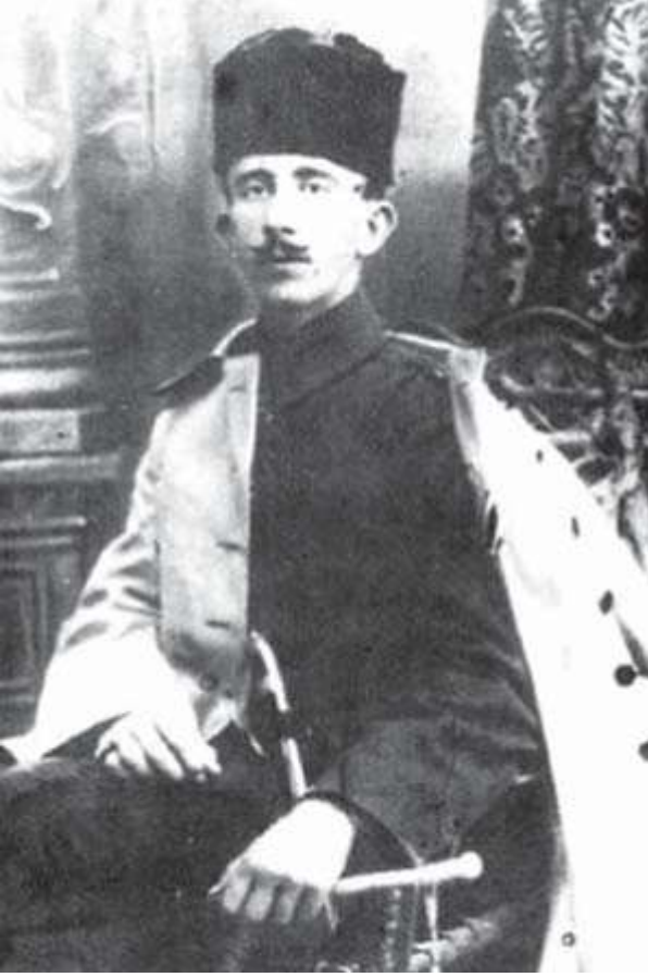
Hacı Emin El-Hüseyni, 1. Dünya Savaşı başında Osmanlı subayı üniformasıyla

Kudüs Müftüsü olarak anılan Muhammed Emin el Hüseyni (1895 -1974) Kahire'de El-Ezher üniversitesinde bir yıl kadar İslam Hukuku okumuş; 1913'te 18 yaşlarında Mekke'ye gidip hacı olmuş, İstanbul'da öğrenimini sürdürürken I. Dünya Savaşı patlak verince topçu subayı olarak İzmir'de görev yapmıştı.