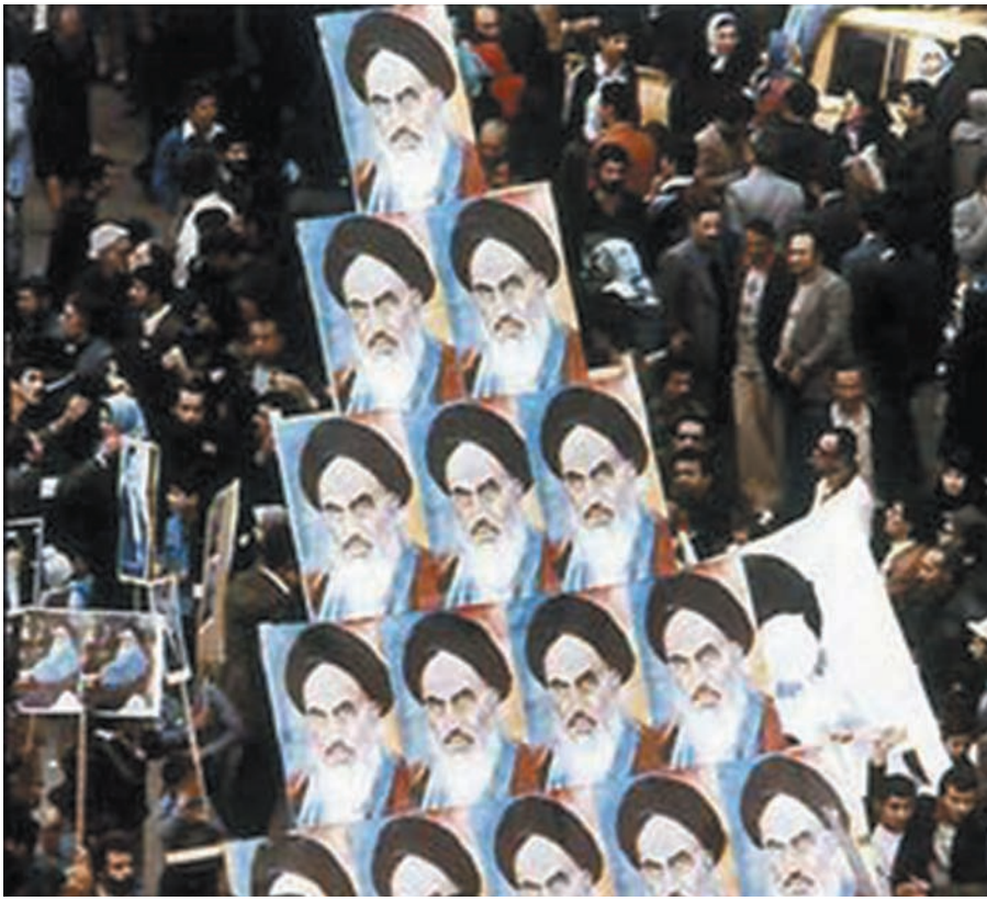
15 yıllık sürgünden Tahran'a dönen Ayetullah Humeyni, İran Devrimi'nin lideri olarak büyük sevgi gösterileriyle karşılandı.

genel beklentileri açısından doyumsuzluk tepkilerini dışı vuran alt ve orta sınıf, radikal öğrenci gruplarının sokak gösterilerini destekliyor, bu ortamda Humeyni, şahın zaman yitirilmeden devrilmesi çağrılarını yineliyordu.