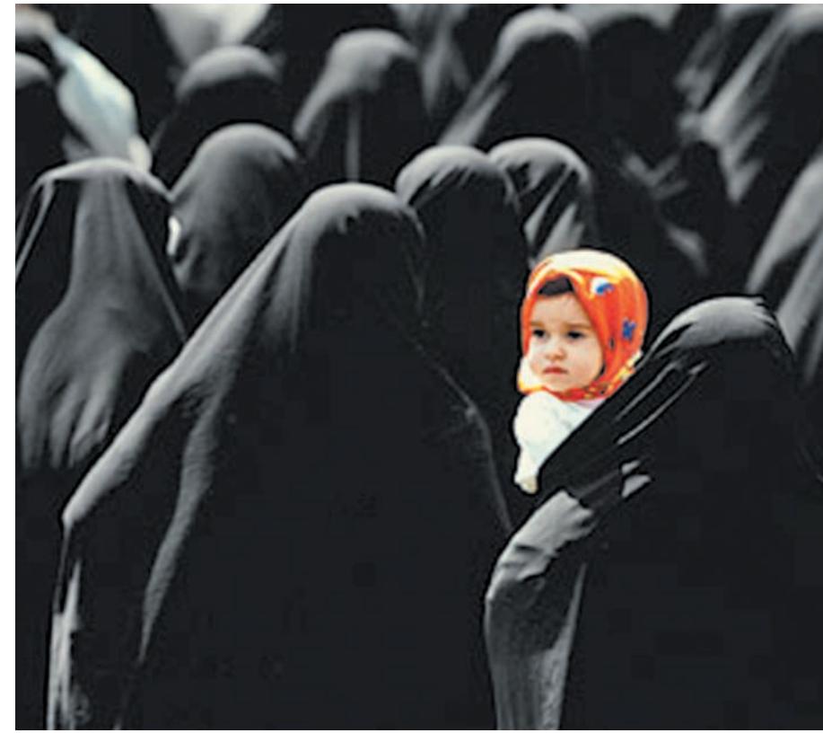
Humeyni'nin yönetimi altına geçen İran'da kadınlar, erkeklerle eşit olarak sahip oldukları haklarını yitirdiler ve çarşaf giymeye zorlandılar.

Humeyni'nin şah tarafından sürgüne gönderilmesinin 15'inci yıldönümü olan 4 Kasım 1979 Pazar günü, gösterici öğrenciler ABD'nin Tahran Büyükelçiliği'ni basıp diplomatları ve elçilik çalı-