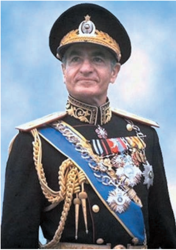
İran'ın son şahı Rıza Pehlevi

da sona erdiğinin, “diplomatik dille” ifadesi olmuştu. İran'ı işgal eden güçlerin petrol uğruna tahta oturduğu Şah Muhammed Rıza Pehlevi, günü geldiğinde işi bitmiş tüm piyonlar gibi, Washington tarafından bir anda “delikten aşağı” süpürülmüştü.